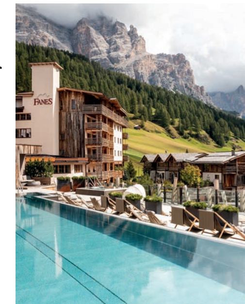
DOLOMITI WELLNESS HOTEL FANES, A SAN CASSIANO

Spa & Wine nelle Langhe, in un antico monastero, tra vigne, tartufi, funghi e colline. Una finestra spirituale sulla natura, senza tempo, le vigne più preziose d'Italia, culle dei grandi vini rinomati nel mondo, le nocciaie e le colline di una campagna dolce e colorata, patrimonio mondiale Unesco. La Spa dimora in un raffinato ex monastero, luogo di meditazione, che ha preservato l'eredità del passato e la magia dell'acqua, sulla Via del Sale, antico percorso lungo il quale era trasportato a dorso di mulo, e dove oggi l'oro prezioso dai poteri straordinari è impiegato nella Talassoterapia della Grotta del Sale. Completano il percorso la biosauna, la vinoterapia con il Nettare di Bacco nell'Hamam DiVino, i trattamenti con prodotti a base di nocciole, al profumo di Barolo e ingredienti del territorio e aromi dell'orto officinale.