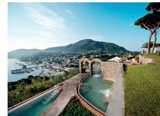
SAN MONTANO RESORT & SPA DI LACCO AMENO

Sapori autentici e benessere in Toscana, tra momenti di pace, camminate nelle campagne nobili e tra gli uliveti che effondono aria di lunga vita, tra terapie e trattamenti etruschi, tradizionali e moderni. Arricchiti di ingredienti e profumi locali, come uva, rosmarino, olio d'oliva, miele, pappa reale e corredi del piacere dell'ozio e del riposo o di ritmi più dolci, con esperienze di yoga nel giardino della Spa. Raffaella Dallarda